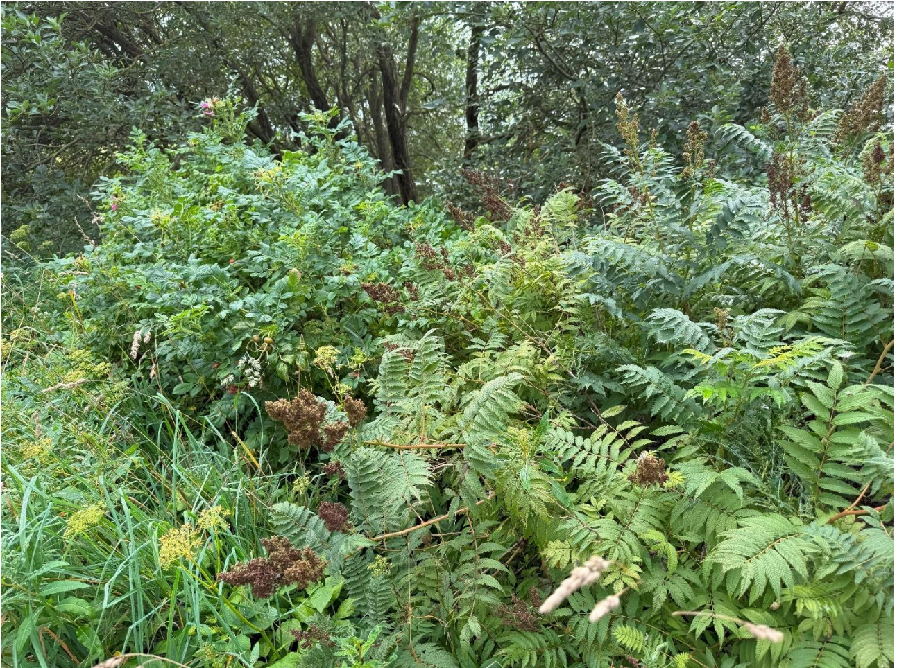
Figur 2-2: Rynkerose (til venstre) og rognspirea (til høyre) innenfor tiltaksområdet.