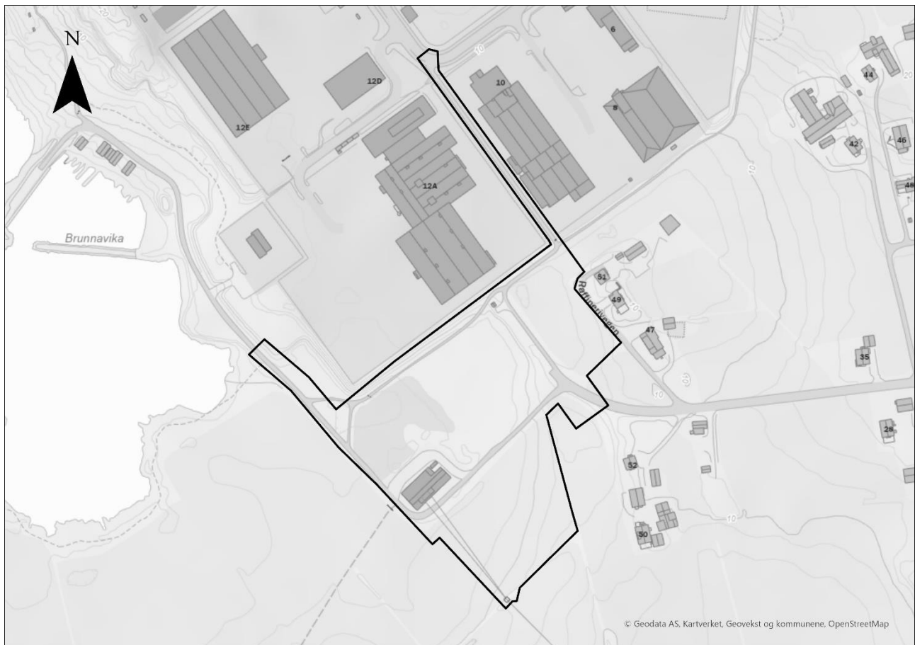
Figur 1-1: Tiltaksområde for Tjora transformatorstasjon.

Norconsult engasjert til å gjennomføre en kartlegging av forekomstene av fremmede arter innenfor tiltaksområdet (figur 1-1). Formålet er å avdekke eventuelle forekomster, samt å gi faglige anbefalinger for hvordan anleggsarbeidene kan gjennomføres for å unngå videre spredning. Denne rapporten presenterer resultatene fra kartleggingen og beskriver nødvendige tiltak for å sikre forsvarlig håndtering og hindre videre spredning av fremmede arter i forbindelse med tiltaket.