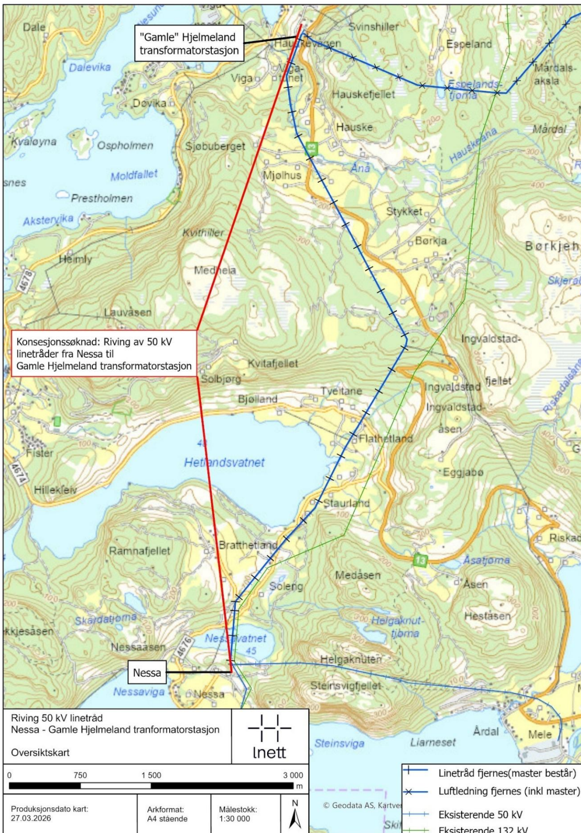
Figur 1 Oversiktskart