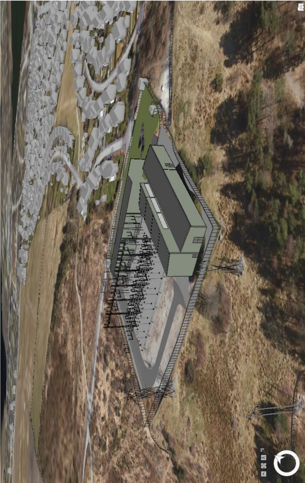
Figur 4 3D modell av Ullandhaug transformatorstasjon sett fra drone mot nordvest