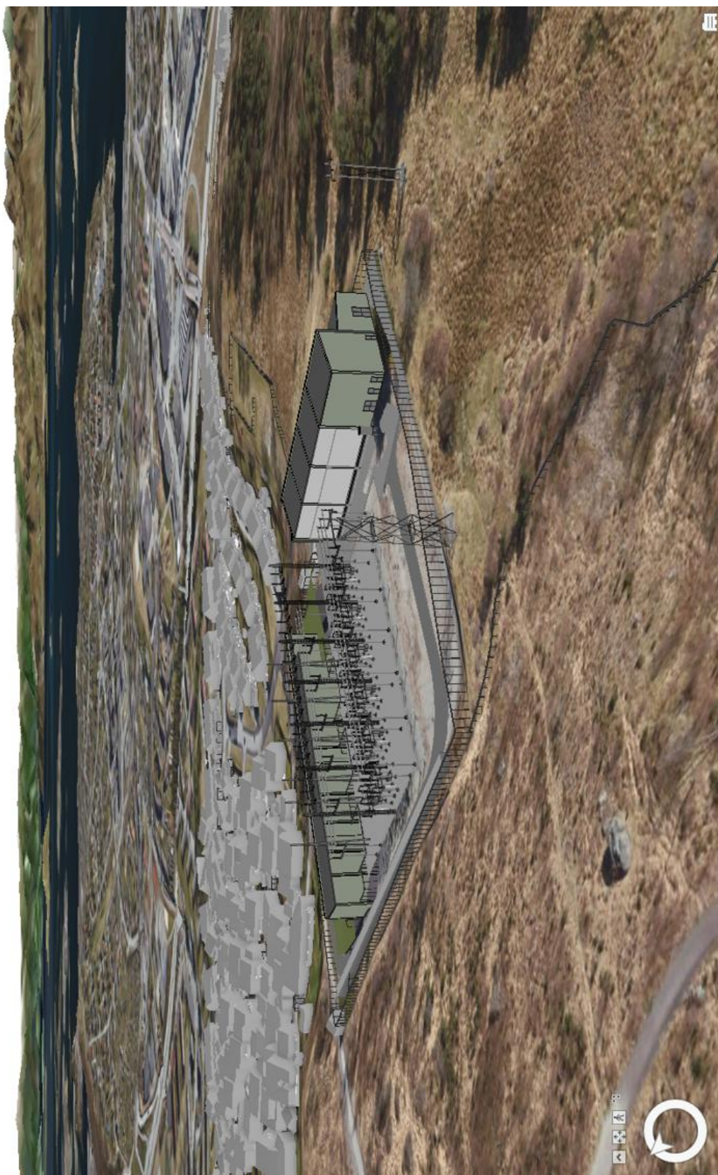
Figur 3 3D modell av Ullandhaug transformatorstasjon sett fra drone mot nordøst