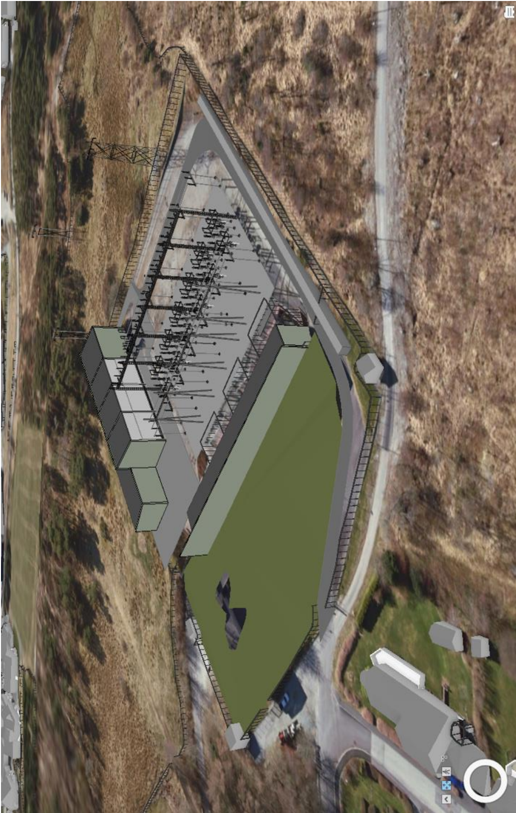
Figur 2 3D modell av Ullandhaug transformatorstasjon sett fra drone mot sørøst