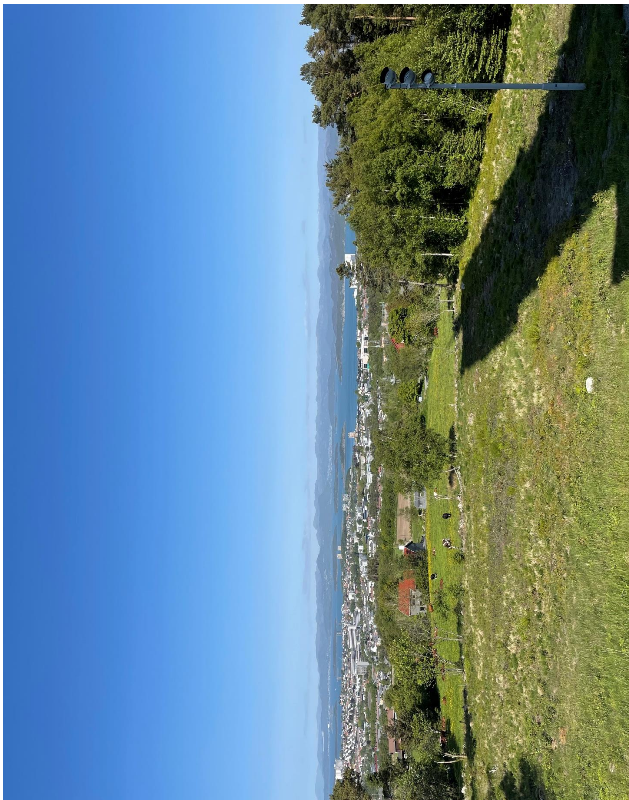
Figur 5 Utsikt fra Ullandhaugtårnet mot Ullandhaug transformatorstasjon (foto: Lnett, 1. juni 2023)